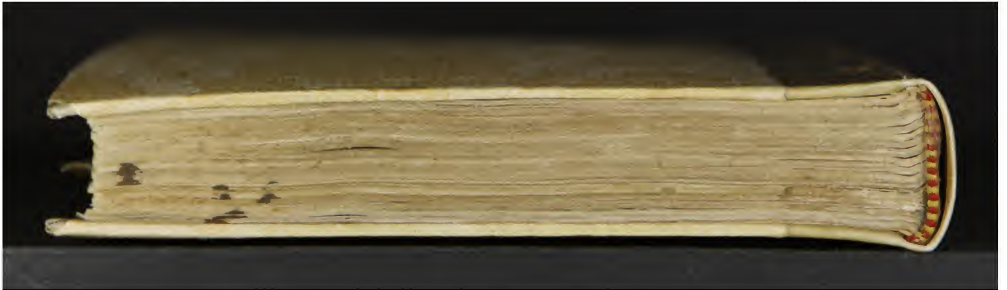
Magl. A.5.64